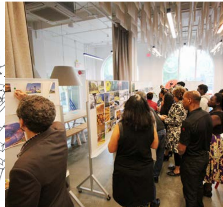
霍根巷工作室，2017年五月

重新開發緬街 (Main St.) 以東和以西的每一個街區為我們帶來了一個獨一無二的機遇，讓我們有機會糾正過去的一個歷史時段遺留下來的問題 - 即以摧毀多元化社區為代價發展以車為主的城市公路，這樣的模式與溫哥華現狀衝突也不符合我們憧憬的溫哥華的未來。